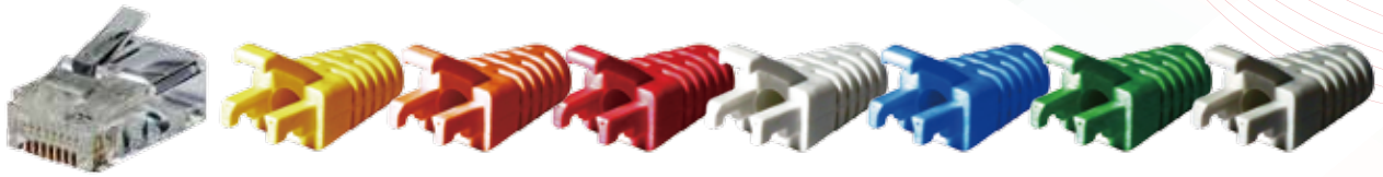
RJ45 CAT.5E UTP