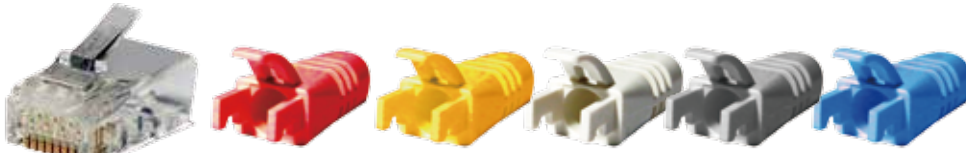
RJ45 CAT.6 UTP