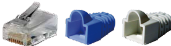
RJ45 CAT.5E UTP/FTP 雙排單件式