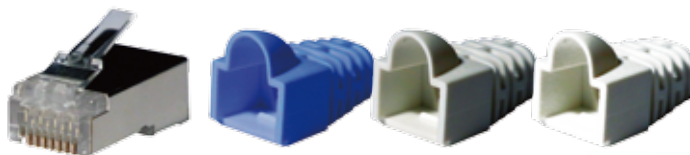
CAT.6 FTP 雙排三件式