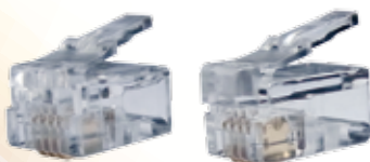
RJ11/12 Telephone 兩又大拐腳(單股線用)